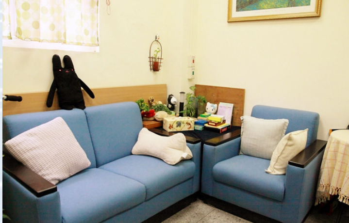
▲校園諮商室空間示意圖。

教育部為了強化大專院校學生輔導工作，增進國民的心理健康。除了根據於民國103年旨在促進與維護學生身心健康及全人發展，並健全學生輔導工作特制定的〈學生輔導法〉，明確規定國高中以下輔導老師、及大專院校臨床/諮商心理師等專業輔導人員及各級學校在輔導工作上的相關程序及規範。更為了協助解決大專校院學生輔導相關事宜，達到加強校際聯絡、建立大專校院學生輔導