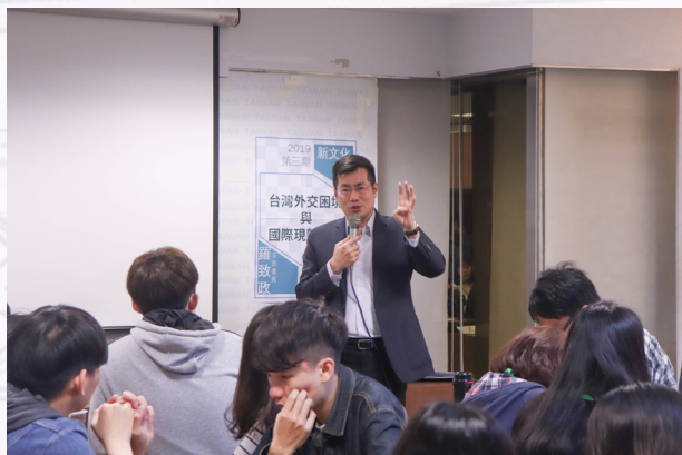
▲立法委員羅致政運用專業講述、分析台灣外交困境。

29日課程為「台灣外交困境與國際現勢分析」，本次邀請立法委員羅致政分析目前台灣的外交與國際現勢。從基礎的國際關係理論跟同學解釋國際社會的常態與國家間的關係，而牽動國家，促使外交行為的最大因素就是「國家利益」。