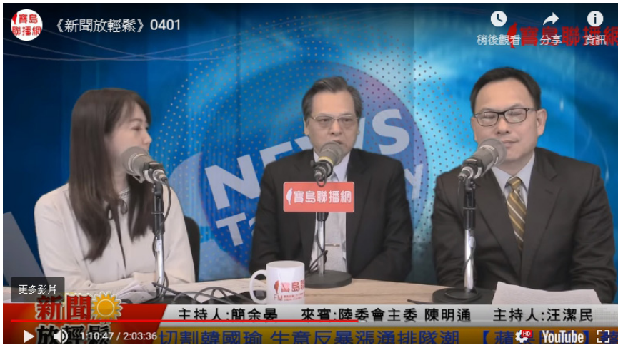
▲ 陸委會主委陳明通接受網路節目訪問。