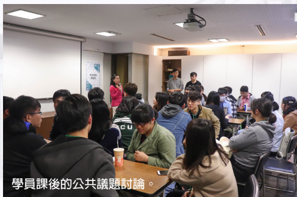
學員課後的公共議題討論。

但是，尚有個理想值在，不論是政治或是社會的議題，都希望能超越同溫層，使更多人願意參與這樣類型的活動，讓大家更多替這個社會盡一份心，而不是只有等事情波及到自己本身，才想要上街頭去做抗爭，而是會想關心這個社會，多一分監督政治的發展。