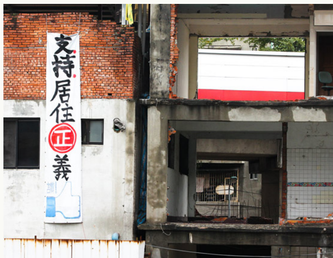
▲ 2012年文林苑都更案極具爭議性。

2018年12月立法院初審通過《都市更新條例修正草案》，就該草案修正之內容而言，簡化都更程序，並建立「3+1」道程序(俗稱文林苑條款)，只要有爭議就強制舉行聽證，經實施、地方政府協調不成後才能由政府代拆，藉此減少釘子戶。