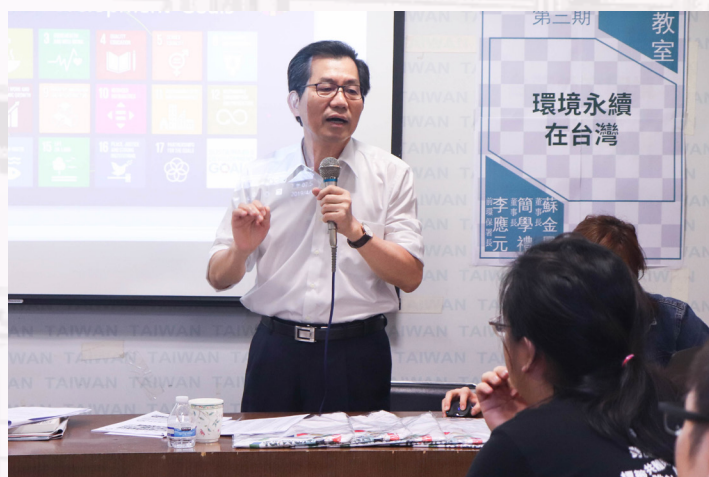
▲前環保署長李應元分享台灣環境永續願景。

新文化教室第三期的課程在羅文嘉秘書長的壓軸精彩演講後圓滿落幕，新文化基金會在這之後還會推出其他精采活動，敬請期待！