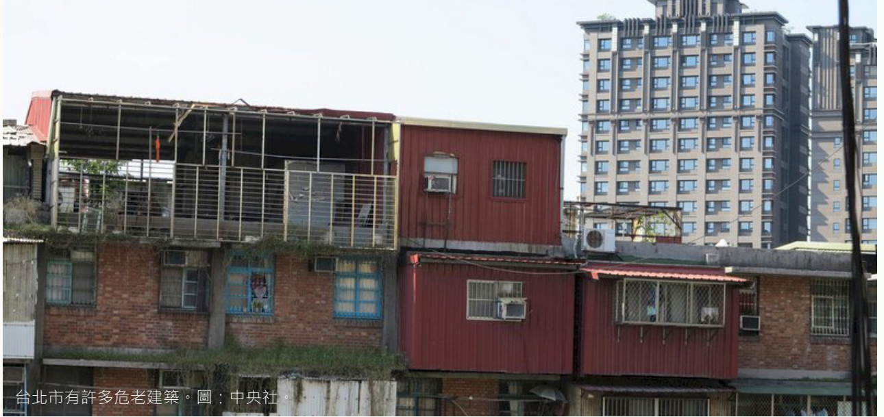
台北市有許多危老建築。

承載，故無須涉及都市計畫檢討。這在學理上值得好好討論，但放在當下「容積獎勵成為房產交換價值」的現實來看，實在難有說服力。